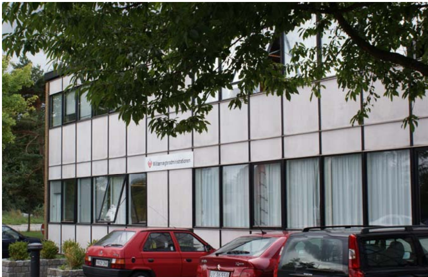
Militærnægteradministrationens domicil i Hedehusene, hvor militærnægteren på sin første dag i sin værnepligt skal give møde til introduktionsdag

Telefonkonsultation i øvrigt skal foretages i tidsrummet kl. 9.00 til kl. 15.00.